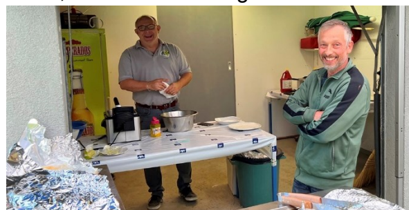
Sie hatten ihren Job im Griff: Die Kollegen am Grill und im Service!

Keiner wusste, wie oft der Kantonalfinal schon in Seen-Gotzenwil zu Gast war. Aber jede und jeder bestätigte, dass die Gastgeber einmal mehr hervorragende Arbeit geleistet hatten. Im schiesstechnischen Bereich liessen sie keine Wünsche offen und das Wort «Gastgeber» nahmen sie wörtlich und verwöhnten die Gäste mit allem, was das Herz begehrt.