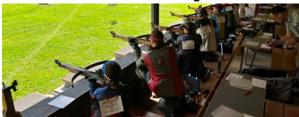
Schuss um Schuss - Spannung pur.

Der alles entscheidende Finaldurchgang der besten aus den Vorläufen für den Final qualifizierten Sportlerinnen und Sportler war für die Zuschauer - aber auch für die Athletinnen und Athleten - ein wahrer Nervenkitzel. Die Pfeile wurden kommandiert abgegeben und so waren die Zuschauer und die Sportschützinnen und Sportschützen laufend über ihr aktuelles Resultat und den aktuellen Zwischenrang informiert.