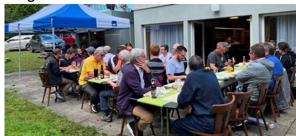
Man fühlte sich wohl in Seen-Gotzenwil.

Wäre noch eine Goldmedaille zu vergeben gewesen, so hätte diese zu Recht an die Kolleginnen und Kollegen der Gastgeber vergeben werden müssen!